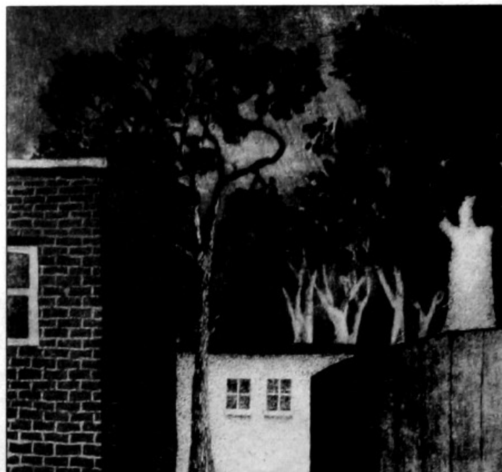
Grafika Robert SCHINDLER

o ženě a o věcech, které už se přece jen nenosí.