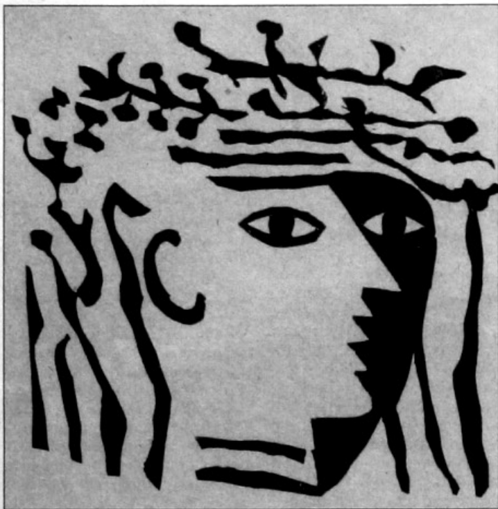
Grafika Vladimír VACULKA

V těchto dnech chodí vyvoleným podivné texty: Náš počítač SL-01 zjistil, že ste typický Moravský Slovák, a proto Vás zve na 1. tajné zasedání Strany placatých, HZAMS, Hnutí Za Moravské Slovensko atd.