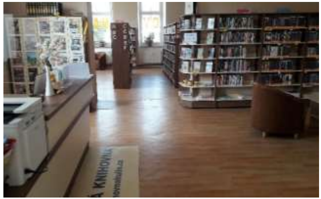
Městská knihovna v Hulíně