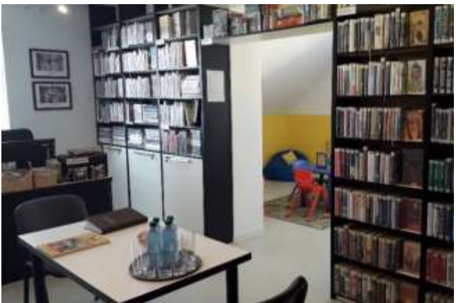
Místní knihovna ve Veselé