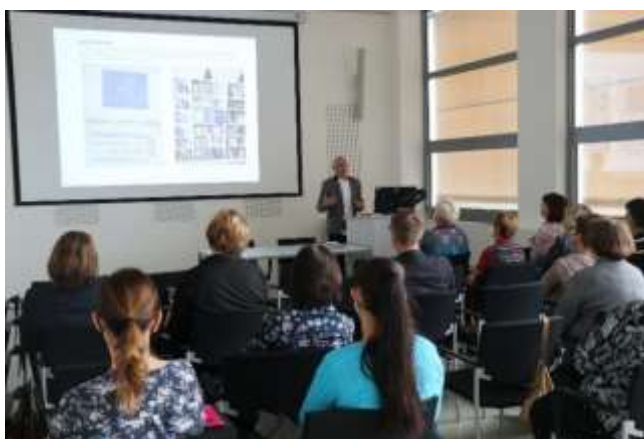
Seminář pro knihovny okresu Zlín

Celkem se těchto odborných akcí zúčastnilo 424 účastníků.