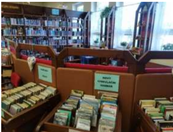
Místní knihovna ve Velkých Karlovicích