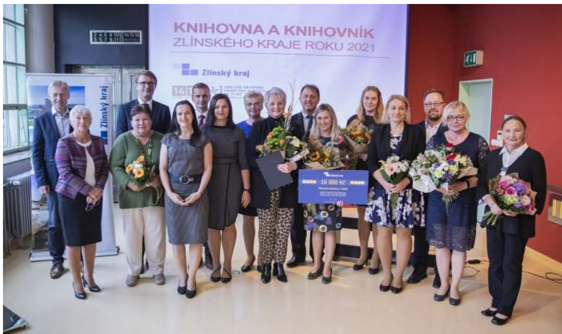
Společné foto všech oceněných