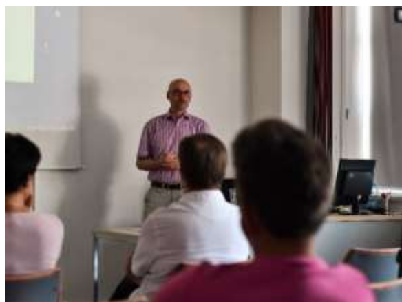
Setkání zřizovatelů a knihovníků okresu Vsetín

Každoročně pořádaný kurz knihovnického minima absolvovalo 16 knihovníků Zlínského kraje.