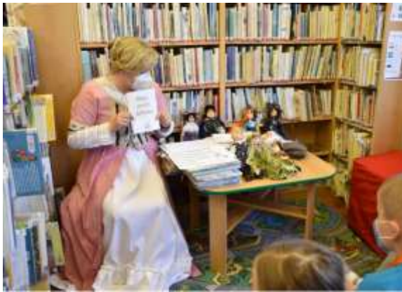
Místní knihovna v Babičích