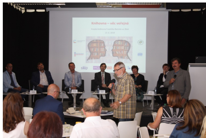
panelová diskuse Knihovna – věc veřejná