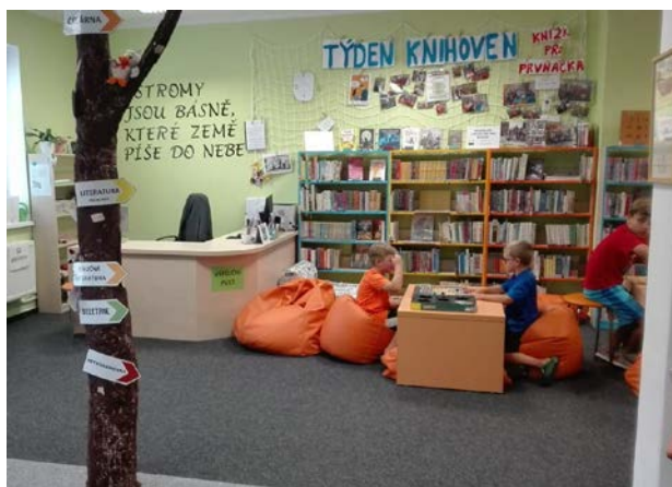
Místní knihovna Dolní Němčí