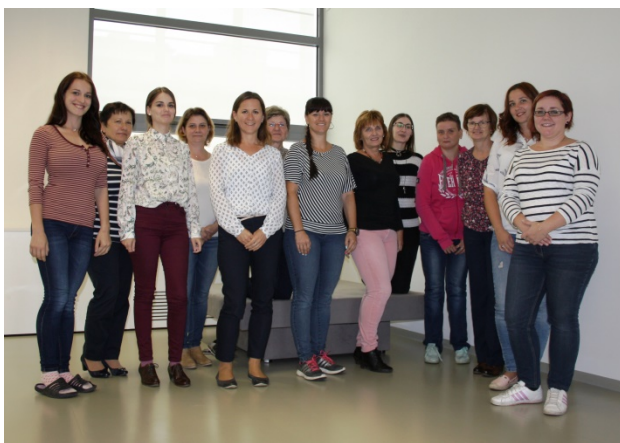
Absolventi kurzu knihovnického minima