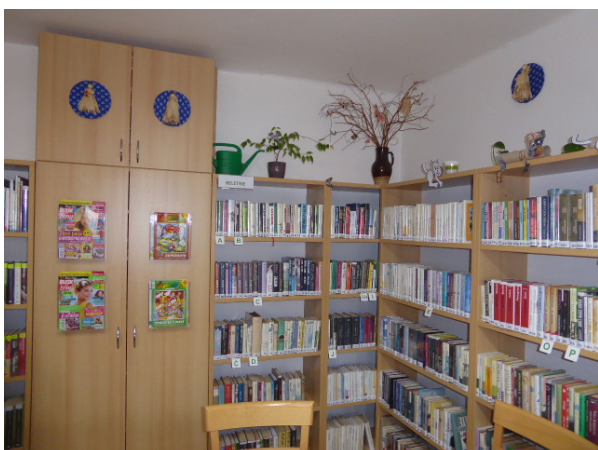
Místní knihovna v Křekově