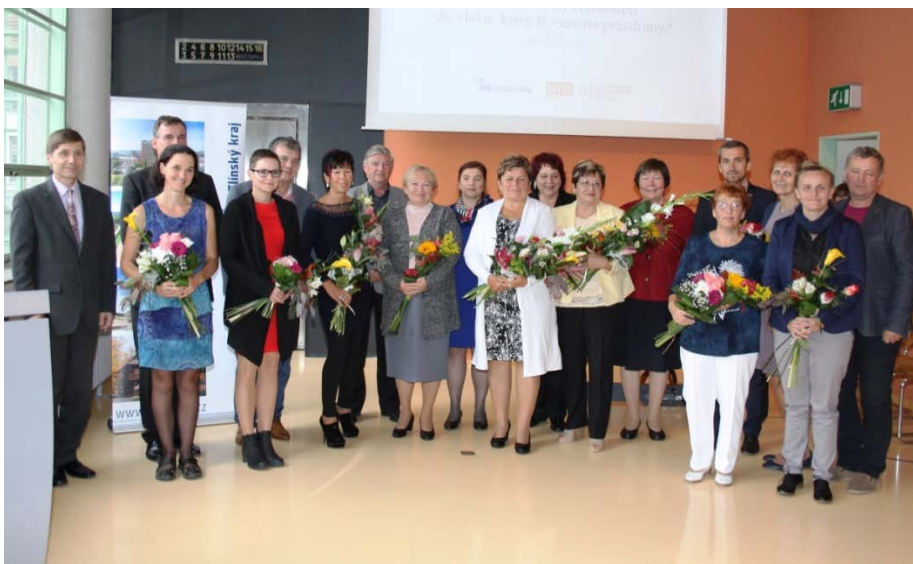
Společné foto všech oceněných

V krajském kole soutěže Vesnice roku získala diplom za moderní knihovnické a informační služby ve Zlínském kraji Místní knihovna Dolní Němčí .