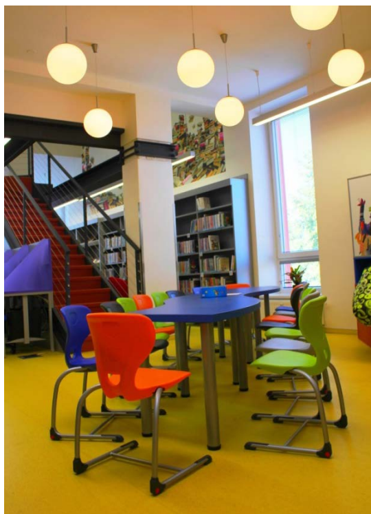
Knihovna města Zubří