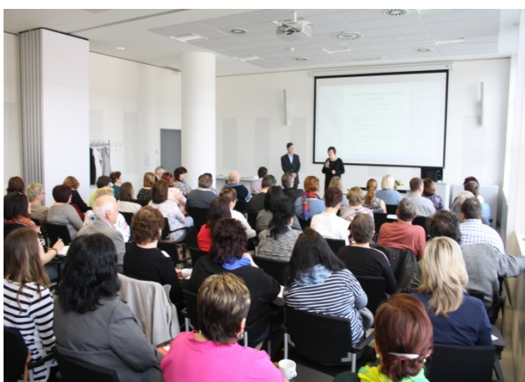
12. setkání knihovníků a starostů okresu Zlín