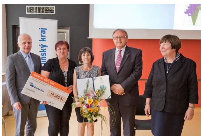
Ocenění Obecní knihovny Rajnochovice