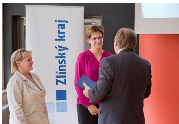
Ocenění Obecní knihovny Oldřichovice