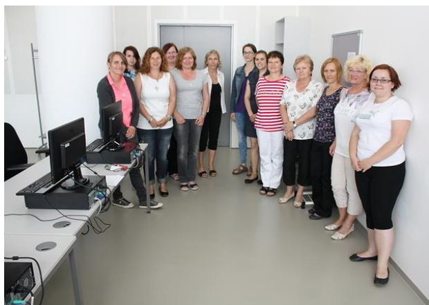
Absolventky kurzu knihovnického minima