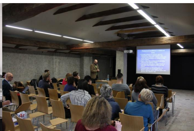
Seminář knihoven paměťových institucí ZK, Kroměříž

Standard byl naplněn – Ve standardu VKIS je stanovený počet hodin pro vzdělávání profesionálních knihovníků 48 hodin a pro vzdělávání neprofesionálních knihovníků 8 hodin. Krajská knihovna uspořádala vzdělávací akce pro knihovníky kraje v takovém rozsahu, aby mohli standard splnit. Všechny standardy VKIS budou vyhodnoceny v 1. čtvrtletí roku 2017 v rámci vyhodnocení plnění standardů VKIS.