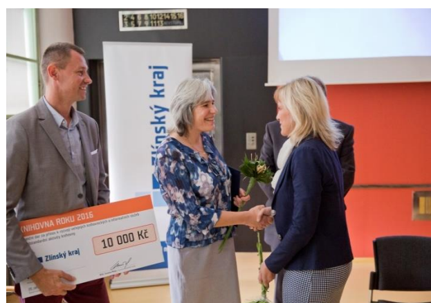
Ocenění Místní knihovny Veletiny