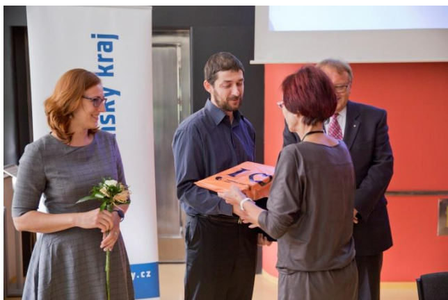
Ocenění Městské knihovny Rožnov pod Radhoštěm