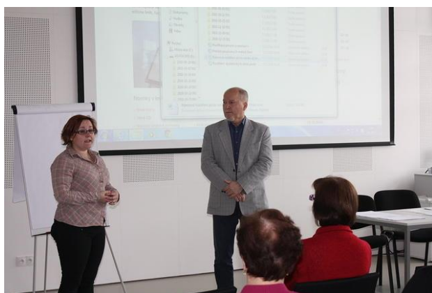
Seminář Dětské čtenářství a dyslexie