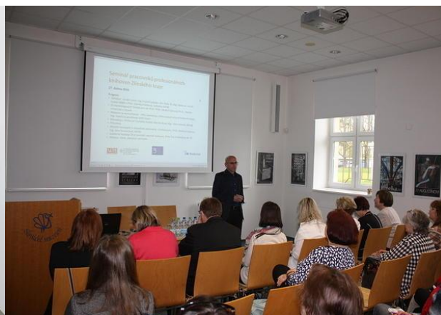
Krajský seminář knihoven ZK, Uherské Hradiště