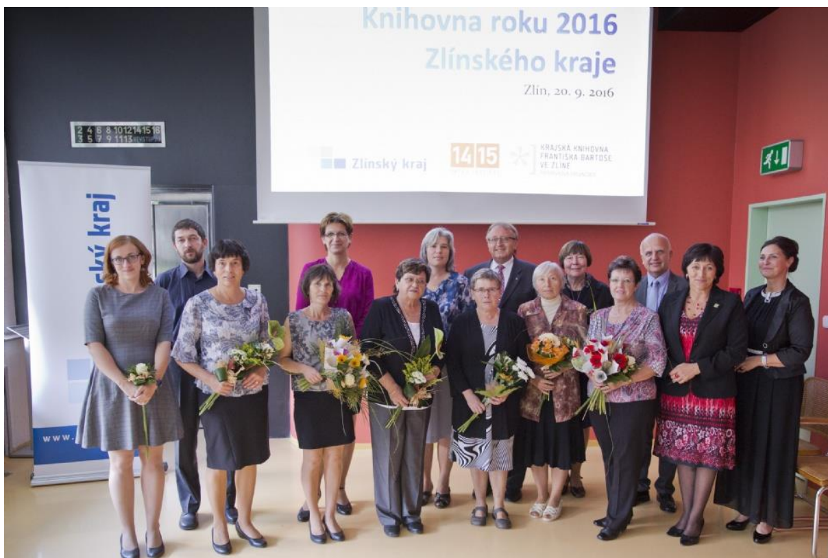
Společné foto všech oceněných