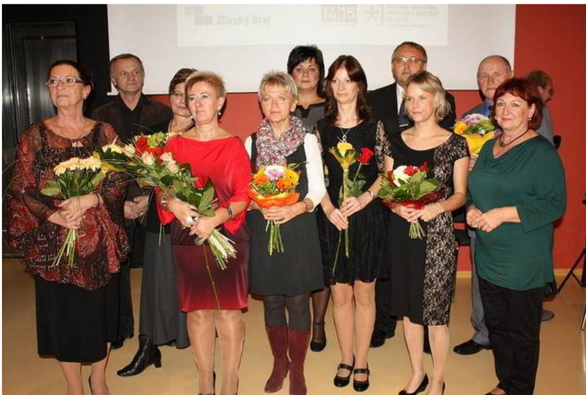
Společné foto všech oceněných