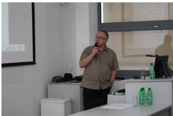
Elektronické služby knihoven III