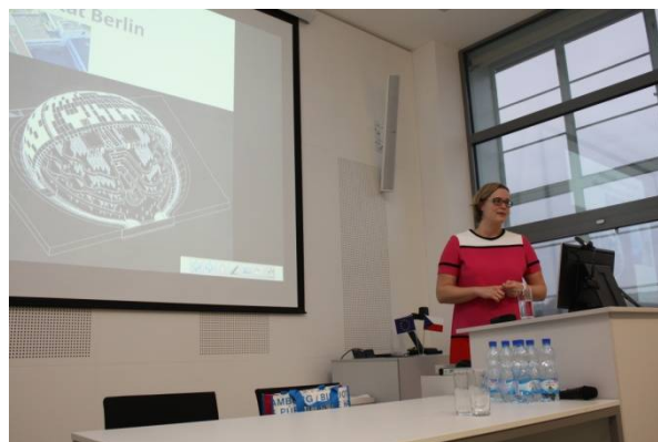
Seminář pro knihovníky okresu Zlín

Standard byl naplněn – Ve standardu VKIS je stanovený počet hodin pro vzdělávání profesionálních knihovníků 48 hodin a pro vzdělávání neprofesionálních knihovníků 8 hodin. Krajská knihovna uspořádala vzdělávací akce pro knihovníky kraje v takovém rozsahu, aby mohli standard splnit. Všechny standardy VKIS budou vyhodnoceny v 1. čtvrtletí roku 2016 v rámci vyhodnocení plnění standardů VKIS.