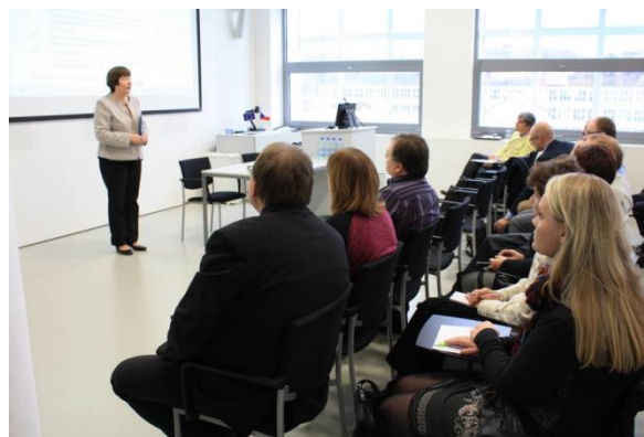
Seminář knihoven paměťových institucí ZK