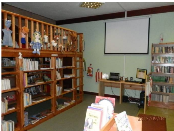
Místní knihovna Slavkov