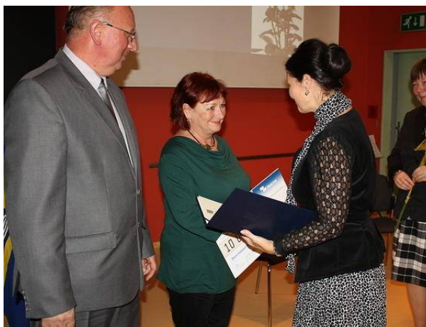
Ocenění Obecní Karasovy knihovny Hutisko-Solanec