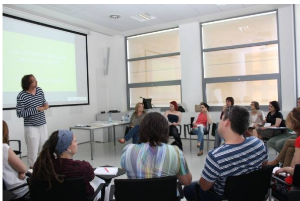
Seminář Informační vzdělávání uživatelů