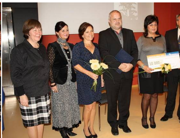
Ocenění Městská knihovny ve Valašských Kloboukách