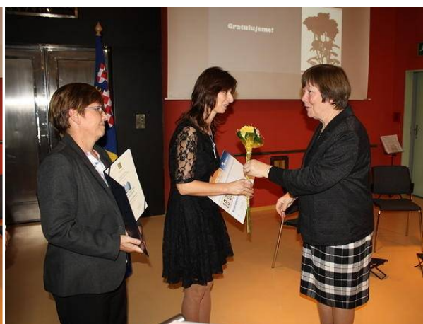
Ocenění Městské knihovny Bojkovice