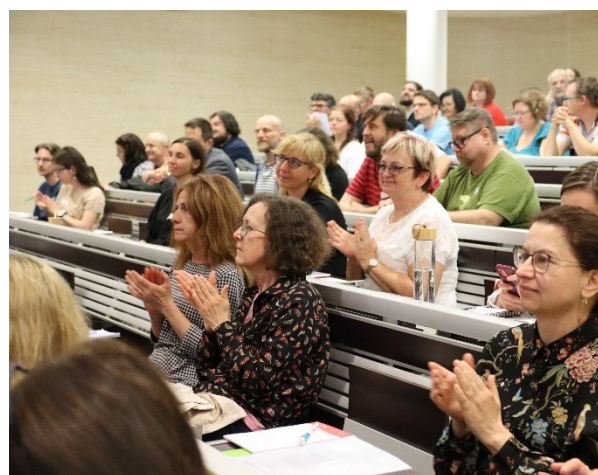
Konference elektronické služby knihoven VII