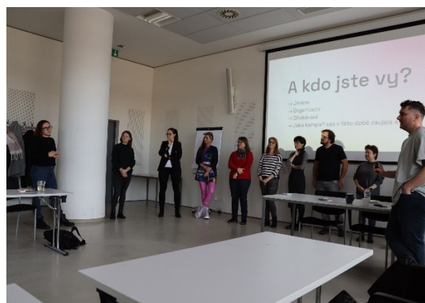
Kurz Nástroje marketingové komunikace

Útvar regionálních služeb knihovnám Zlínského kraje dále připravil a případně se podílel na těchto seminářích a odborných akcích: