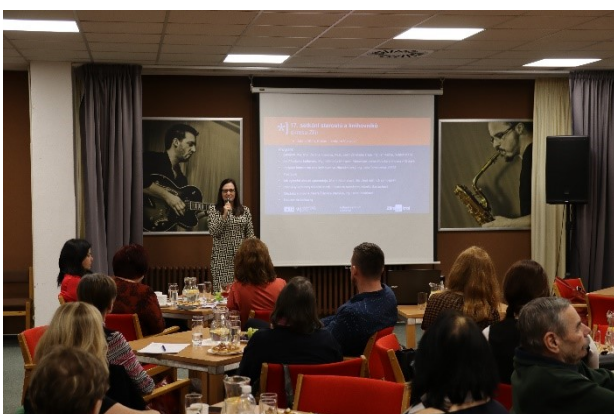
17. setkání starostů obcí a knihovníků okresu Zlín