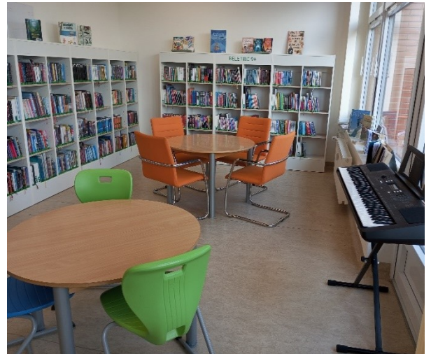
Městská knihovna Valašské Meziříčí