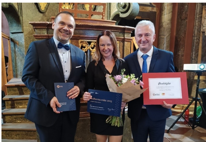
Předání ocenění Knihovna roku Místní knihovně obce Halenkovice v Zrcadlově kapli Klementina