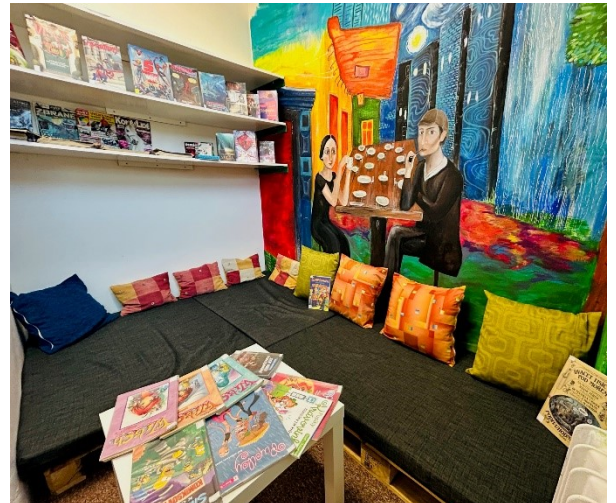
Městská knihovna Bystřice pod Host. – Komiksová zašívárna