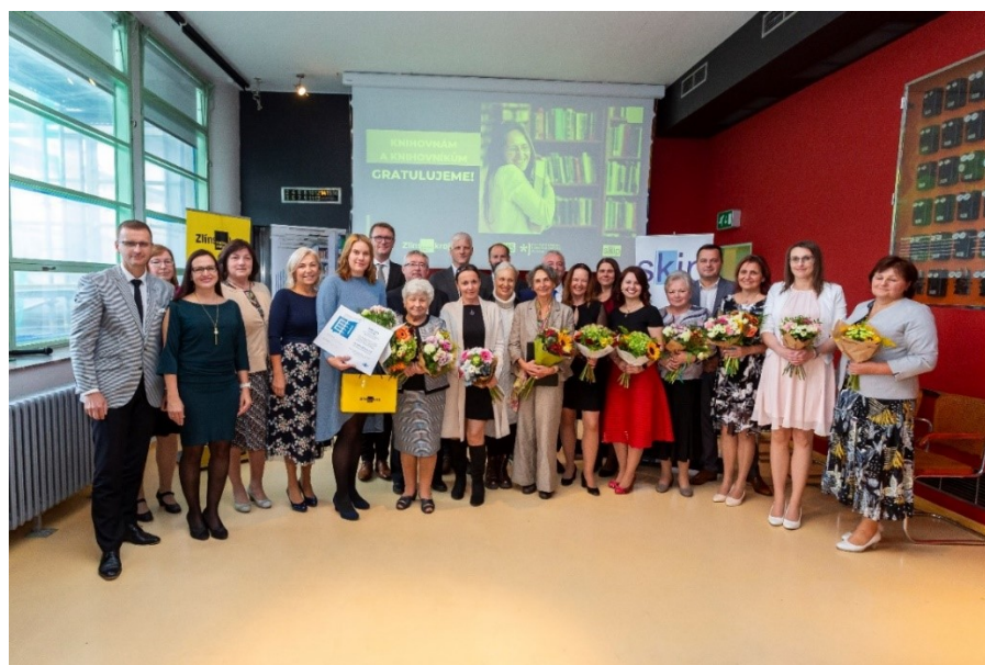
Společné foto všech oceněných