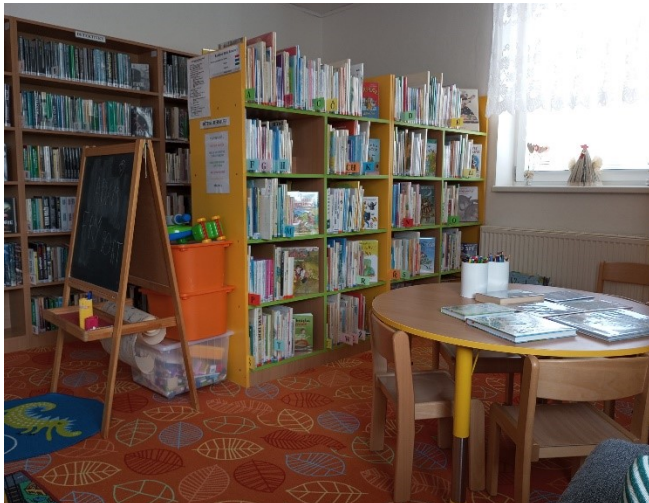
Místní knihovna Ořechov