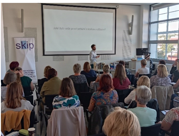
S knížkou do života – Inspirační seminář

Pracovnice útvaru spolupracovaly při přípravě e-learningového kurzu Minimum obecního knihovníka , jehož příprava i pilotní běh byl podpořen dotací MK ČR z VISK 1. V rámci projektu proběhlo pilotní testování kurzu ve Zlínském kraji tak, aby mohl být kurz v roce 2024 nabídnut zdarma k zrcadlení do ostatních krajů České republiky. Kurz se skládá z 10 modulů s časovou dotací 3 hodiny na každý modul, kurz tedy trvá 10 týdnů. Každý týden je otevřen jeden modul, který je zakončen povinným testem. Obsahem jednotlivých modulů jsou výukové texty doplněné o videa, odkazy a studijní materiál ke stažení. Metodičky spolupracovaly při přípravě a natáčení 10 výukových videí. Kurz byl prezentován ostatním knihovnám ČR na celostátní konferenci Regionální funkce knihoven dne 23. 11. 2023 v Pardubicích. Pilotního kurzu v délce 30 hodin se zúčastnilo 26 účastnic z malých knihoven kraje.