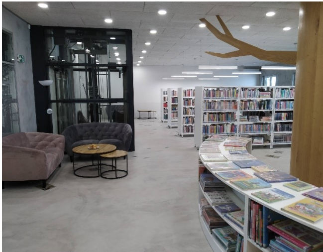
Místní knihovna obce Halenkovice – Knihovna roku 2023