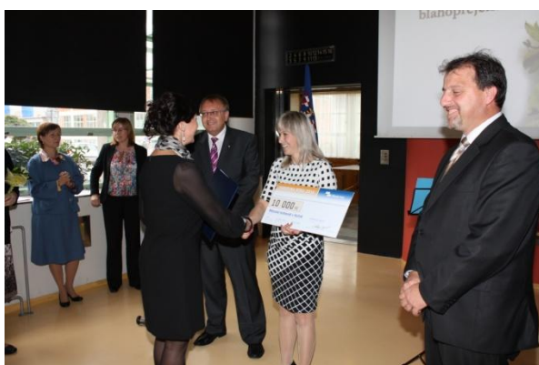
Ocenění Městské knihovny Hulín