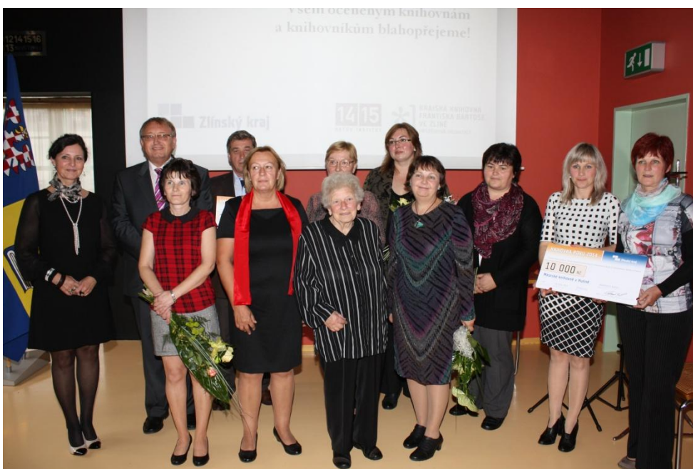
Společné foto všech oceněných