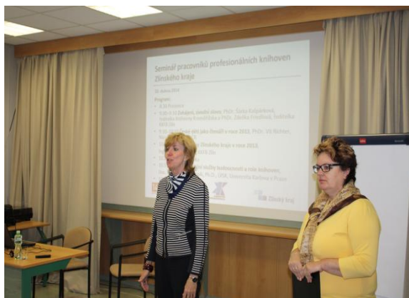
Krajský seminář v Knihovně Kroměřížska