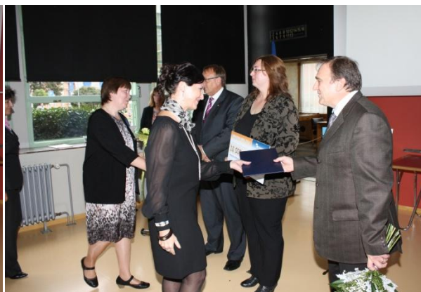
Ocenění Městská knihovny ve Slušovicích