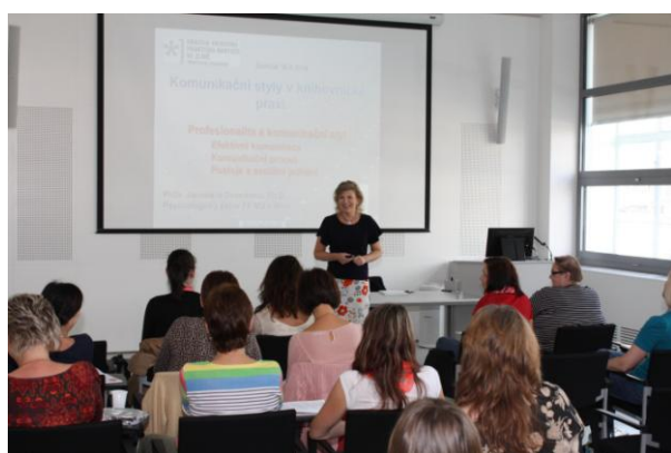
Seminář Komunikační styly v knihovnické praxi

Standard byl naplněn – Ve standardu VKIS je stanovený počet hodin pro vzdělávání profesionálních knihovníků 48 hodin a pro vzdělávání neprofesionálních knihovníků 8 hodin. Krajská knihovna uspořádala vzdělávací akce pro knihovníky kraje v takovém rozsahu, aby mohli standard splnit. Všechny standardy VKIS budou vyhodnoceny v 1. čtvrtletí roku 2015 v rámci vyhodnocení plnění standardů VKIS.