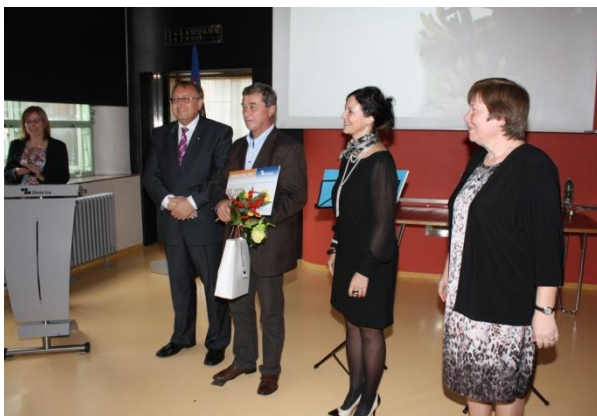
Ocenění Obecní knihovny Horní Lideč