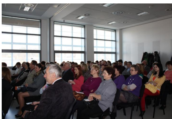
Seminář pro starosty a knihovníky okresu Zlín