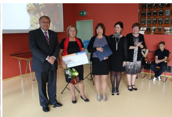
Ocenění Místní knihovny v Modré