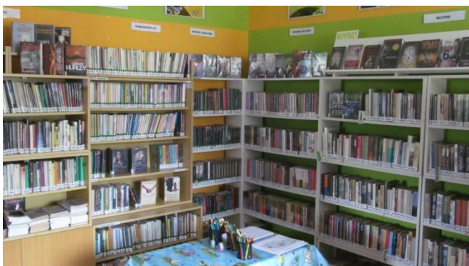
Obecní knihovna Bohuslavice nad Vlčí