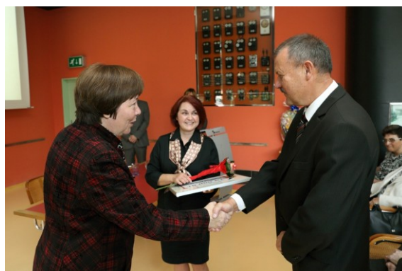
Ocenění Obecní knihovny Starý Hrozenkov