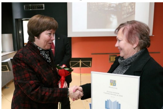
Ocenění Základní knihovny Jablunka