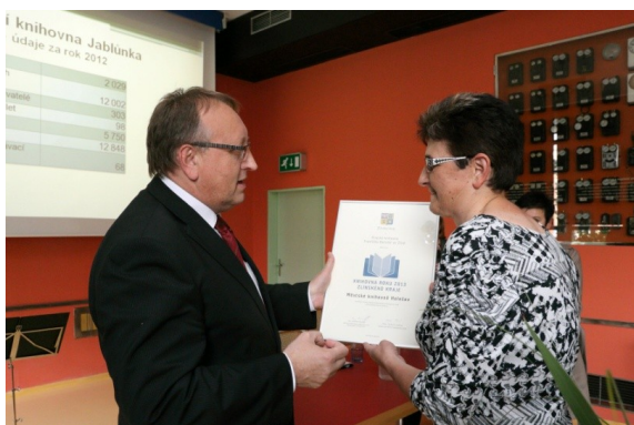
Ocenění Městské knihovny Holešov