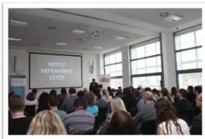
Konference Elektronické služby knihoven V