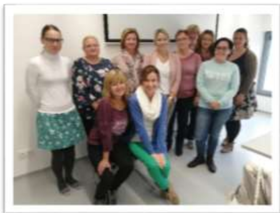
Absolventi kurzu knihovnického minima