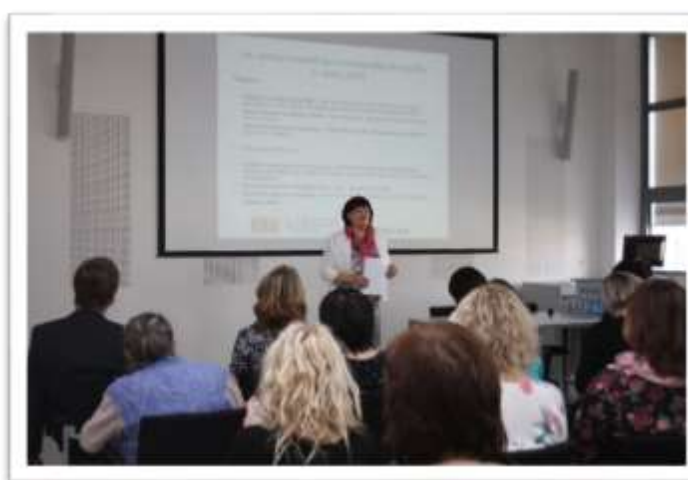
Seminář pro starosty a knihovníky okresu Zlín