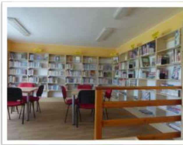
Místní knihovna Zborovice