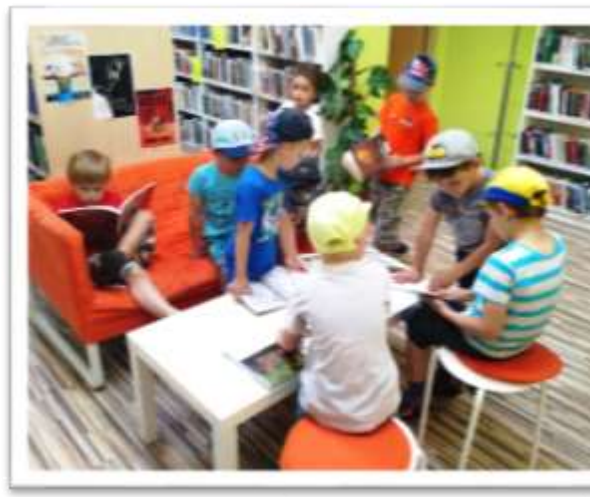
Obecní knihovna Valašská Bystřice