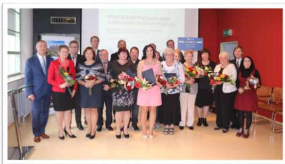
Společné foto všech oceněných