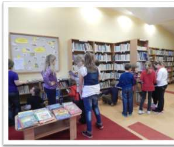
Obecní knihovna Vlachovice