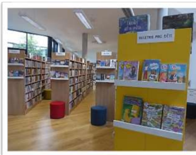
Místní knihovna Ostrožská Nová Ves