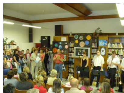
Po setmění v knihovně (7. 10.)