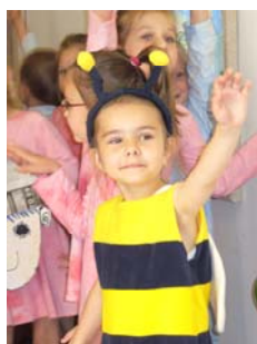
Děti Zlína kreslí a malují – vernisáž z výstavy vítězných prací soutěže Kniha a já a Film a já (25. 5.)