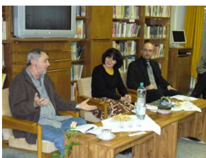
Představení knihy Antonína Bajaji Na krásné modré Dřevnici (9. 12.)