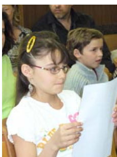
Vyhlášení výsledků okresního kola literární soutěže Hledání (15. 4.)