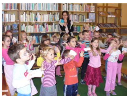
Poprvé v knihovně – pořad pro děti z MŠ v pobožce Kudlov (27. 11.)