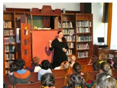
Vystoupení Divadla Bořivoj (Čtení je dobrodružství, 20. 5.)