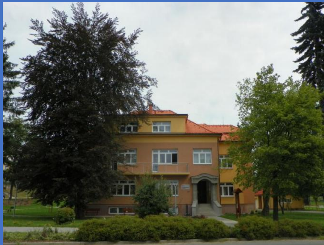
Městská knihovna Slavičín – ocenění v roce 2017