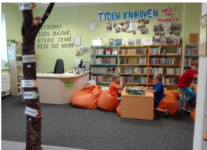
Místní knihovna Dolní Němčí

V krajském kole soutěže Vesnice roku získala diplom za moderní knihovnické a informační služby ve Zlínském kraji Místní knihovna Dolní Němčí .