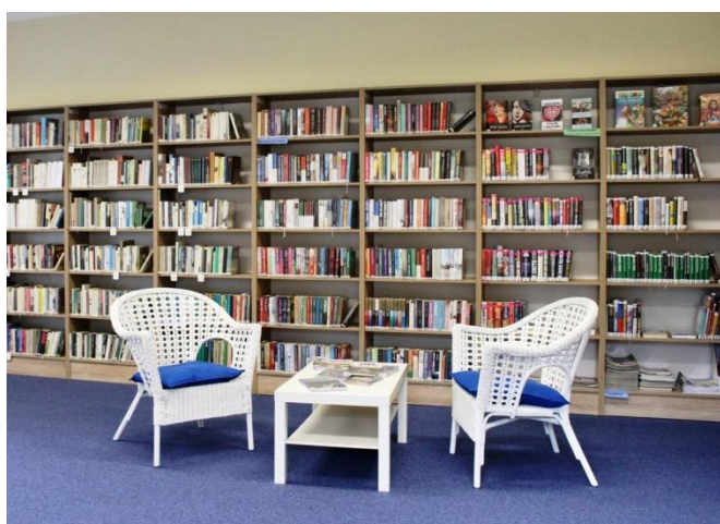
Obecní knihovna Rymice