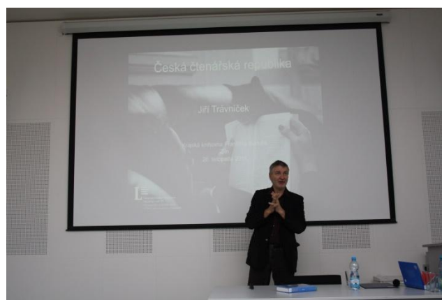
Seminář pro knihovníky okresu Zlín

Standard byl naplněn – Ve standardu VKIS je stanovený počet hodin pro vzdělávání profesionálních knihovníků 48 hodin a pro vzdělávání neprofesionálních knihovníků 8 hodin. Krajská knihovna uspořádala vzdělávací akce pro knihovníky kraje v takovém rozsahu, aby mohli standard splnit. Všechny standardy VKIS budou vyhodnoceny v 1. čtvrtletí roku 2019 v rámci vyhodnocení plnění standardů VKIS.