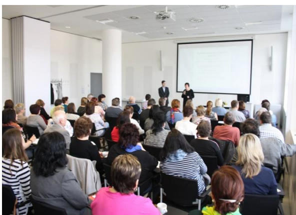
12. setkání knihovníků a starostů okresu Zlín