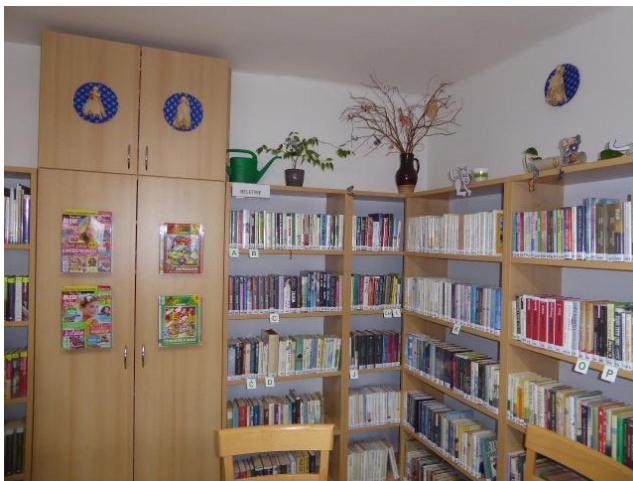
Místní knihovna v Křekově