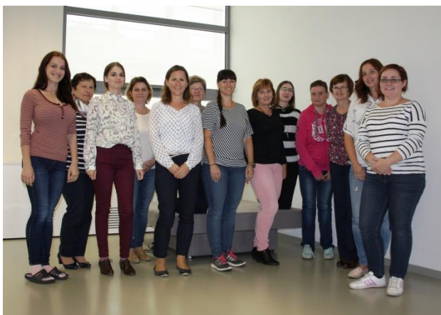
Absolventi kurzu knihovnického minima