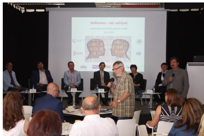
panelová diskuse Knihovna – věc veřejná