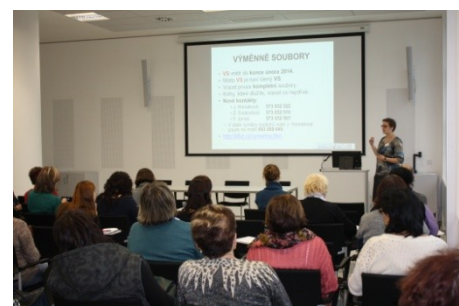
Seminář pro knihovníky okresu Zlín (13. listopadu)