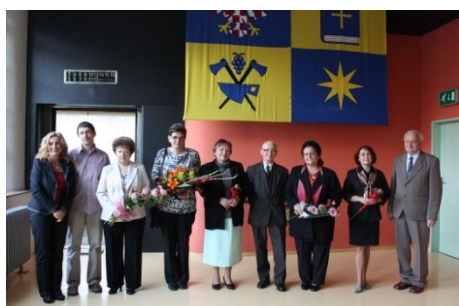
Ocenění nejlepších knihoven a knihovníků Zlínského kraje (10. října)