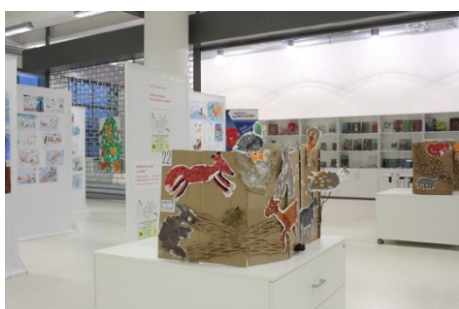
Výstava Zvířátka v zimě (prosinec)