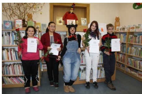
Vyhlášení Čtenáře roku (26. března)