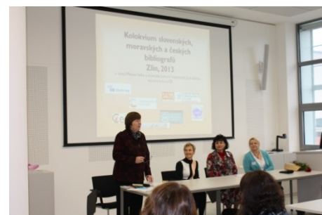
Kolokvium slovenských, moravských a českých bibliografů (6. a 8. října)