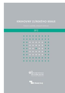
Obálka ročenky Knihovny Zlínského kraje : Činnost a výsledky veřejných knihoven 2012