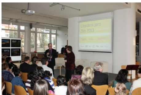
Zahájení Literárního jara (8. dubna)