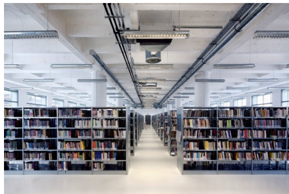
Naučná literatura, 4. podlaží