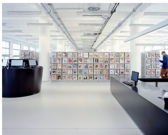
Nové prostory knihovny v budově 15