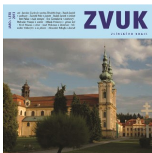
Obálka časopisu ZVUK Zlínského kraje, jaro/léto 2013