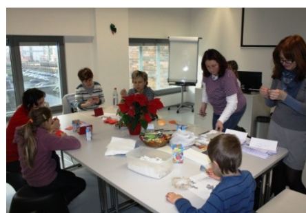
Vánoční výtvarná dílna (17. prosince)