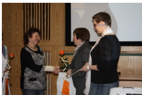
Seminář 8. setkání starostů obcí a knihovníků okresu Zlín (3. dubna)