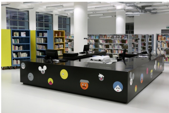
Oddělení pro děti, 3. podlaží