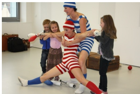
Tančiček Adušiadáši v podání Divadla Kufř, Týden knihoven (2. října)