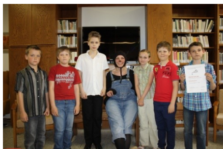
Vítězové okresního kola literární soutěže pro děti (24. dubna)