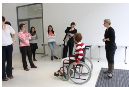
Seminář Bezbariérová knihovna (23. a 30. října)