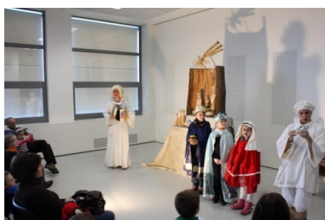
Den pro dětskou knihu (30. listopadu)