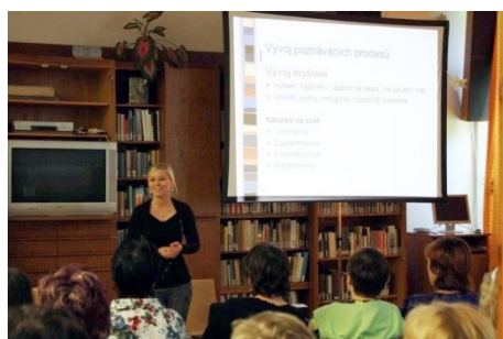
Seminář Klubu dětských knihoven Zlínského kraje Dítě předškolního věku (25. 5. 2011)