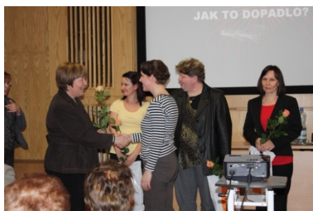
Na semináři 6. setkání starostů obcí a knihovníků okresu Zlín byl vyhlášen Nejlepší knihovnik zlínského regionu (30. 3. 2011)