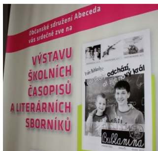
Výstava školních časopisů a literárních sborníků (ve spolupráci s občanským sdružením Abeceda, 2.–30. 9. 2011)