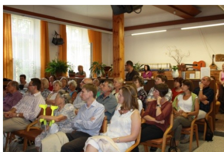
Knihovna, galerie, muzeum 21. století. Beseda o působení institucí v rekonstruovaných budovách 14. a 15. v továrním areálu (31. 8. 2011)