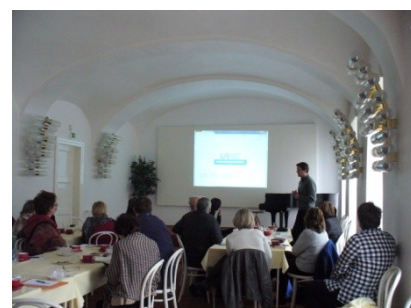
XI. Seminář knihoven paměťových institucí Zlínského kraje (15. 11. 2011, Valašské Meziříčí)