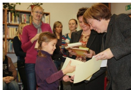
Den pro dětskou knihu, předání odměn v soutěži Moje oblíbená pohádková postavička (26. 11. 2011)