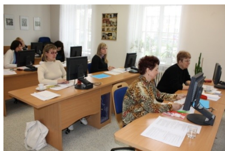
Kurz Knihovnické minimum proběhl v jarních měsících roku 2011