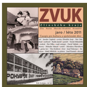
Obálka časopisu ZVUK Zlínského kraje, jaro/léto 2011