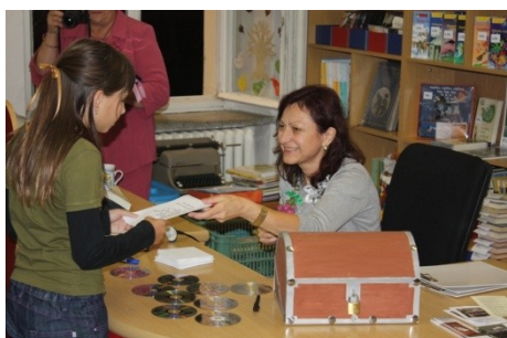
Erbenova pokladnice pohádek, Po setmění s Erbenem (5. 10. 2011)