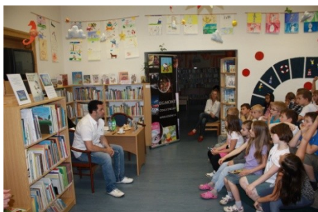
Martin Dejdar v Čítárně u čerta s knihou (2. 6. 2011)