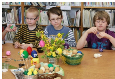
Velikonoční výtvarná dílna pro děti (19. 4. 2011)