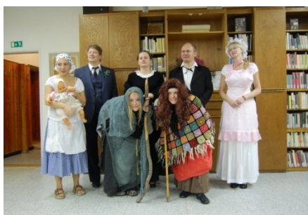
Účinkující večerního programu Po setmění s Erbenem (5. 10. 2011)