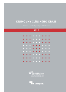
Obálka ročenky Knihovny Zlínského kraje: Činnost a výsledky veřejných knihoven 2010