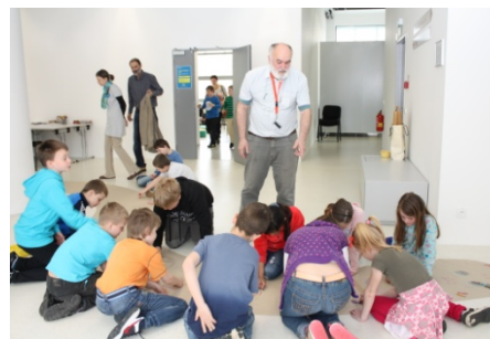
Literární jaro Zlín 2014 – Má přítelkyně žízala (23. dubna)