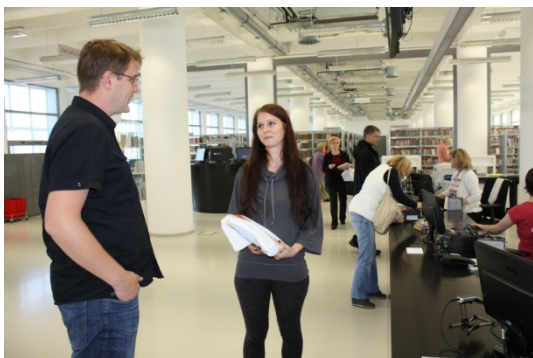
Jubilejní čtenářka v oddělení pro dospělé čtenáře

Za rok 2014 bylo vyřízeno 11 226 objednávek dokumentů ze skladů.