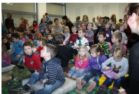
Den pro dětskou knihu (29. listopadu)