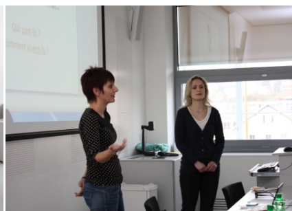
Francouzsko-český klub (2. dubna)