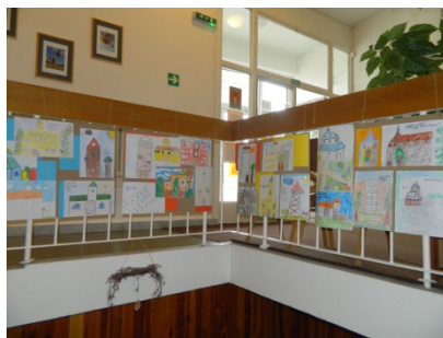
Výstava Jižní Svahy (10. září)