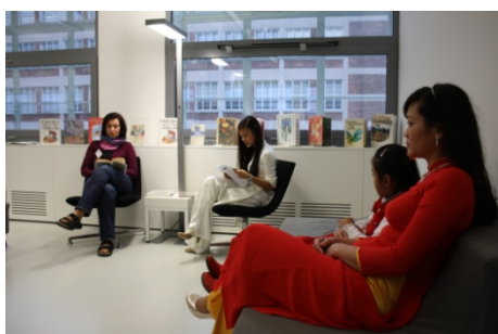
Svět bez hranic (23. října)