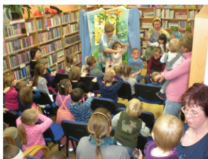
Divadlo Leonka, Malenovice (3. prosince)