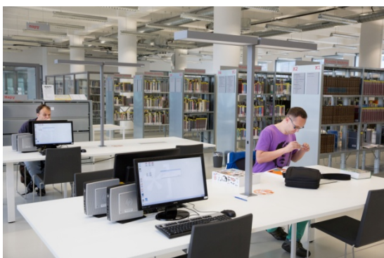
4. podlaží, naučná literatura

K medializaci instituce je využíván rovněž profil knihovny na sociální síti Facebook ( http://www.facebook.com/zlinknihovna ). Jsou zde publikovány informace o aktuálním dění, pozvánky na akce, novinky ve fondu i ze světa literatury apod. Novinkou roku 2014 je facebookový profil určený pro děti a mládež od 13-ti let https://www.facebook.com/zlinteren .