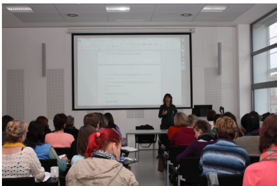
Španělská literatura, seminář (22. ledna)

Knihovna obdržela darem a zařadila do svého knihovního fondu 1 556 dokumentů, především knih od nakladatelů, vydavatelů, statutárního města Zlína, dalších měst a obcí, fyzických osob a dalších subjektů.