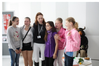
Čítárna u čerta (30. května – 5. června)