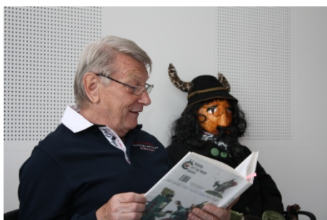
Čítárna u čerta (30. května – 5. června)