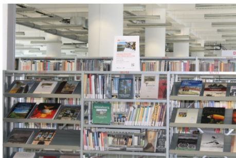
Knihovna primátorů (4. září)