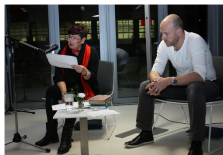
Vánoční řetěz, čtení (10. prosince)