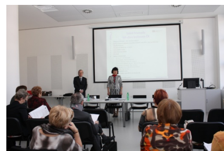
Valná hromada SDRUK (2. dubna)