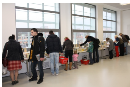
Prodej knih (27. listopadu)