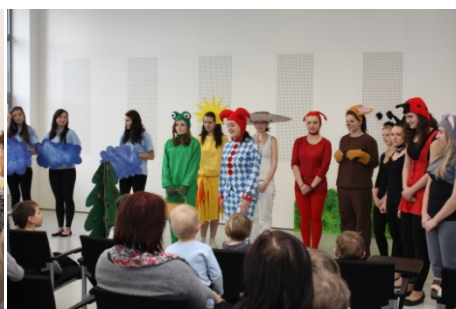
Pohádkové zpívání (14. dubna)