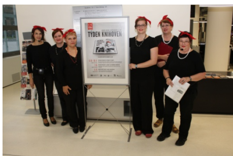
Týden knihoven – Speciální prohlídky (7. října)