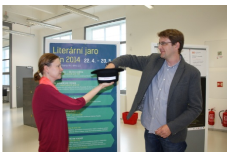
Literární jaro Zlín 2014 - Putování literárním jarem (16. května)