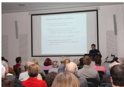
Baťa, Židé, holokaust (19. února)