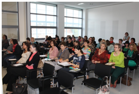
Komunikační styly (16. září)