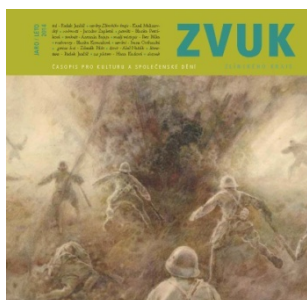
Obálka časopisu ZVUK Zlínského kraje, jaro/léto 2014