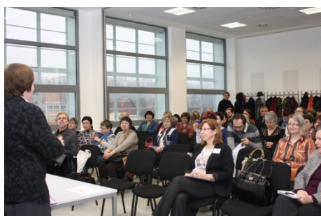
Kolegium SKIP (19. února)