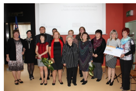
Ocenění knihoven a knihovníků Zlínského kraje (16. října)