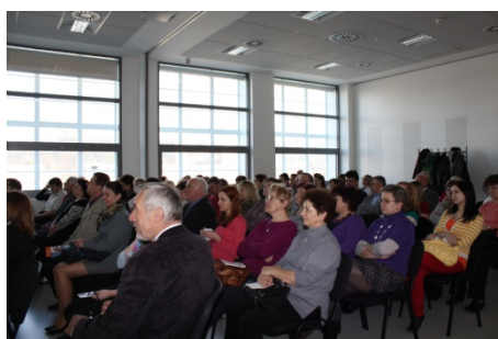
Setkání starostů (26. března)