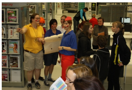
Knihovna ožívá v noci (16. května)