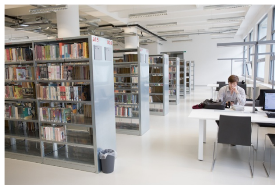
4. podlaží, naučná literatura