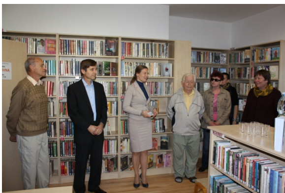
Otevření opravené pobočky Mokrá (30. září)

Na konci roku SMZ začalo řešit projektovou přípravu víceúčelového objektu ve Štípi, kde by měla sídlit i pobočka knihovny.