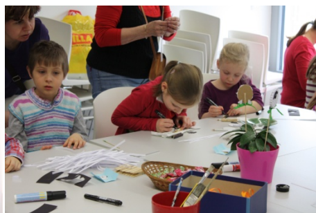
Jarní výtvarná dílna (5. března)