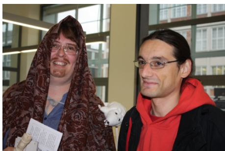
Knihovna ožívá v noci (16. května)