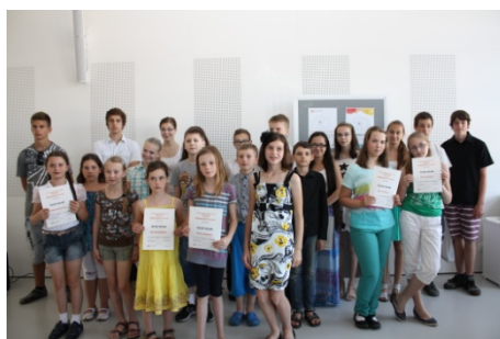
Literární soutěž, krajské kolo (11. června)