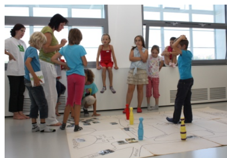
Letní příměstský tábor (7. července)