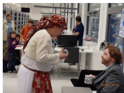
Knihovna ožívá v noci (16. května)