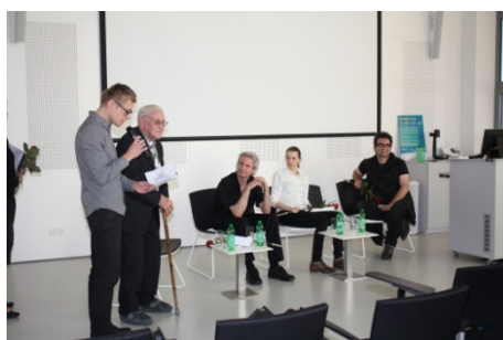
Literární jaro Zlín 2014 Dobří emigranti se vracejí (20. května)