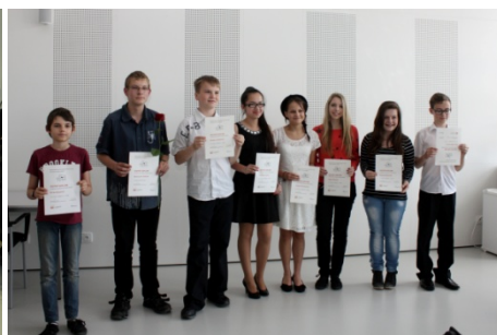
Literární soutěž (30. března)