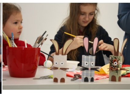
Velikonoční dílna (15. dubna)