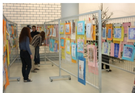
Den pro dětskou knihu (29. listopadu)