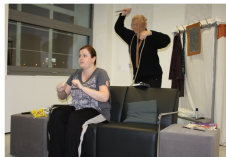
S tvojí dcerou ne, ASPIK (6. října)