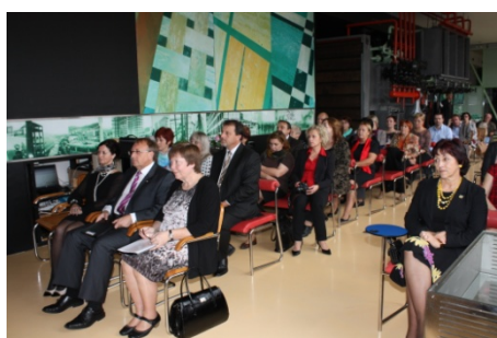
Ocenění knihoven a knihovníků Zlínského kraje (16. října)