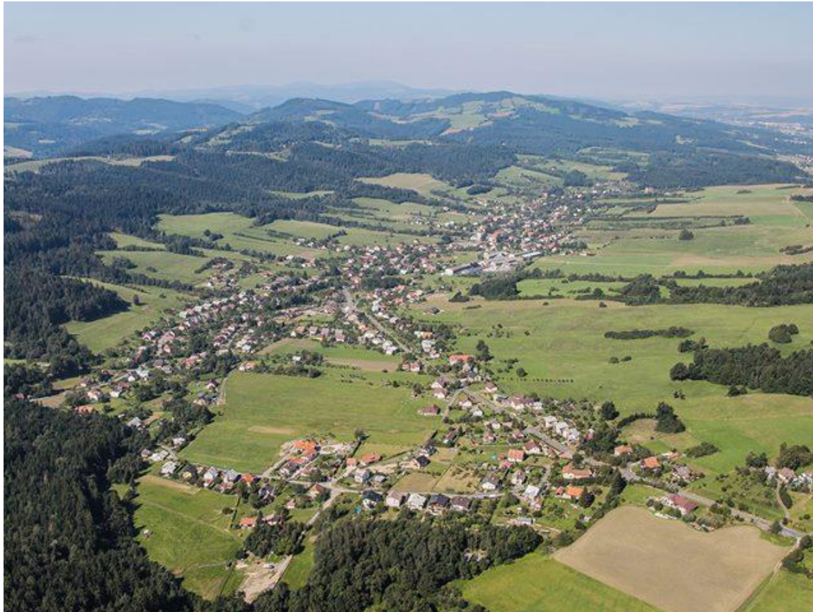
Letecký pohled na obec Vidče