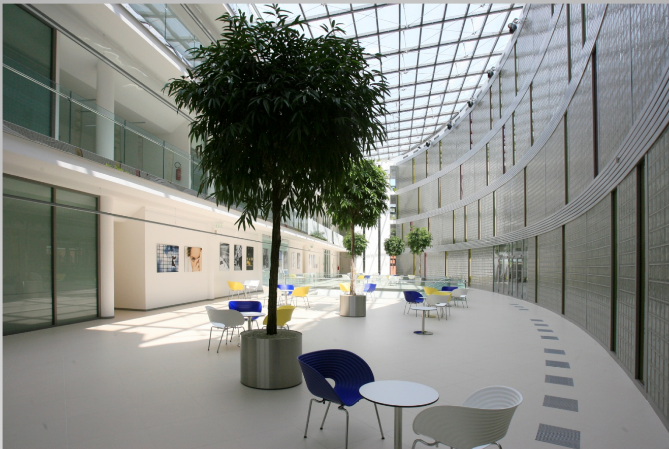
Ústřední knihovna UTB ve Zlíně